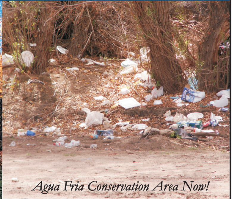
Agua Fria Conservation Area Now!

¡El estado actual del Área de Conservación de Agua Fria!